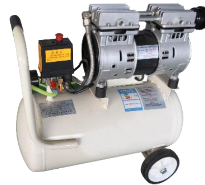
Kompresor je sestavni del strojne opreme PROMAC- 1600 W.