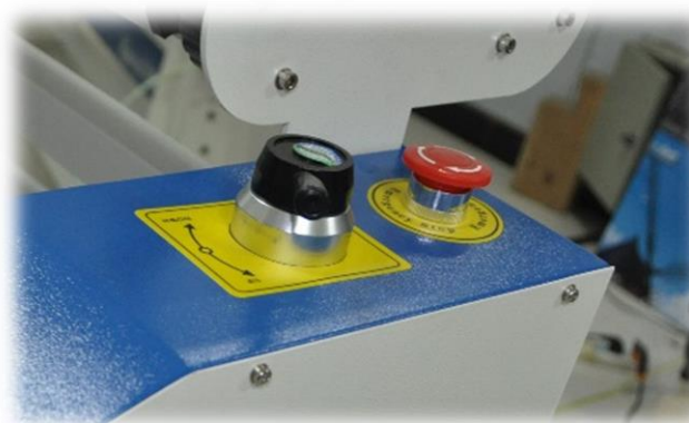
Stikalo za zaustavitev v sili

Metoda infrardečega merjenja temperature je veliko bolj dodelana in natančna, kot standardna metoda meritve temperature.